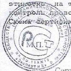
Схема сертификации Зс.

ДОПОЛНИТЕЛЬНАЯ ИНФОРМАЦИЯ Место нанесения знака соответствия: на этикетке на товарно-сопроводительной документации. Инспекционный контроль проводится один раз в год.